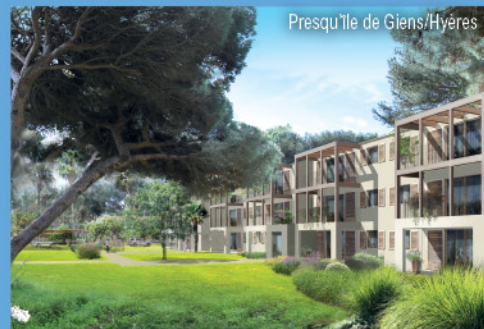
Presqu'île de Giens/Hyères

LOGEMENT : 2 pièces 4 personnes climatisé.