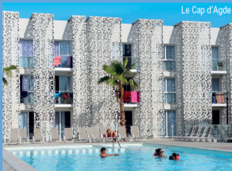
Le Cap d'Agde

LOGEMENT : 2 pièces cabine 6 personnes climatisé.