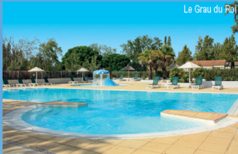
Le Grau du Roi

LOGEMENT : 2 pièces supérieur 3/4 personnes.